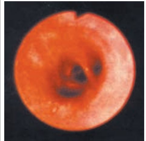
Esta foto muestra una vía respiratoria saludable (parte superior) y una vía inflamada (parte inferior) en el pulmón. El ozono puede inflamar el revestimiento del pulmón, y episodios repetidos de inflamación pueden causar cambios permanentes en el pulmón.