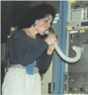
Una voluntaria en un estudio de investigación del ozono respira dentro de un espirómetro—un dispositivo que mide la función pulmonar.

La EPA ha recolectado una gran cantidad de información sobre los efectos del ozono en la salud. Esta información proviene de un número de fuentes, incluyendo la investigación en animales, estudios que comparan estadísticas de salud y niveles de ozono dentro de las comunidades, y pruebas controladas de voluntarios humanos para determinar cómo el ozono afecta la función pulmonar. En estos estudios, los voluntarios son expuestos al ozono en cámaras diseñadas especialmente para este propósito donde sus reacciones pueden ser medidas cuidadosamente. Los voluntarios son preseleccionados por medio de exámenes médicos para determinar su estado de salud, y nunca son expuestos a niveles de ozono que excedan los típicos de las ciudades principales en un día con mucho smog.