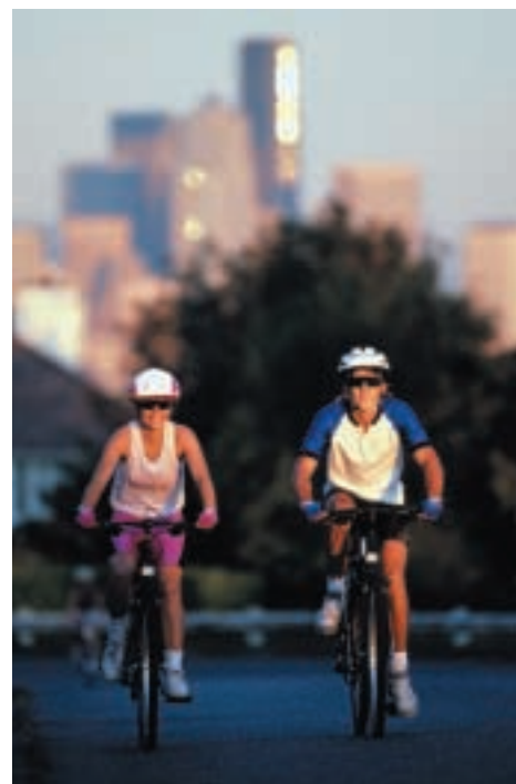
Usted puede ayudar a reducir los niveles de ozono caminando, usando bicicletas, compartiendo el automóvil, o utilizando el transporte público como una alternativa a conducir un automóvil.

Para más ideas sobre lo que usted puede hacer, visite el sitio de la EPA en la red mundial en http://www.epa.gov/airnow/consumer.html .