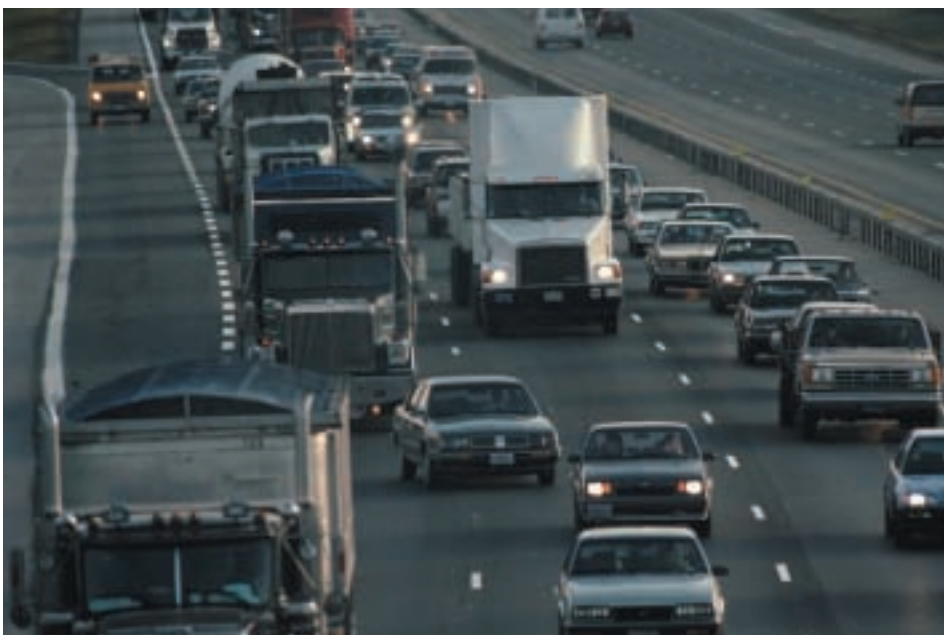
Los vehículos motorizados son un contribuyente importante al smog.

La mejor manera de proteger su salud es informándose sobre cuán elevados son los niveles de ozono en su área y tomando precauciones sencillas para minimizar la exposición—aún cuando no sienta síntomas obvios.